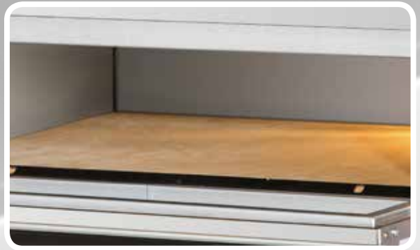
Piano in refrattario alveolare Alveolar refractory stone