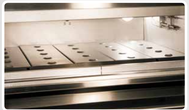
Piano cottura bugnato (opzionale per teglie) Aluminated plate for trays (optional)