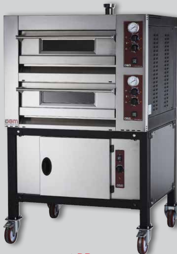
compact DB range

Complète modularité et possibilité de superposer les chambres avec branchement séparé. Réglage de la température par thermostats électromécaniques indépendants pour voûte et sol. Façade et porte en acier inox. Poignée ergonomique en acier inox. Chambre cuisson en tôle aluminée. Vitre porte en matériel vitrocéramique. Isolation en fibre céramique et laine de roche éco-compatibles. Plan de cuisson en réfractaire alvéolaire. Affichage de la température par pyromètre analogique. Température de cuisson jusqu'à 400 °C. Thermostat de sécurité à remise manuelle. Surbaissement-chambre pour épargne d'énergie. Illumination intérieure avec lampe halogène. Sortie des fumées directe (cheminée extérieure optionnelle). Hotte d'aspiration extérieure neutre ou avec moteur et variateur de vitesse reculé (optionnels).